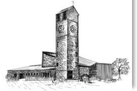
Verklärung Christi Rain