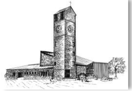
Verklärung Christi Rain