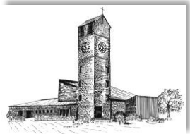
Verklärung Christi Rain