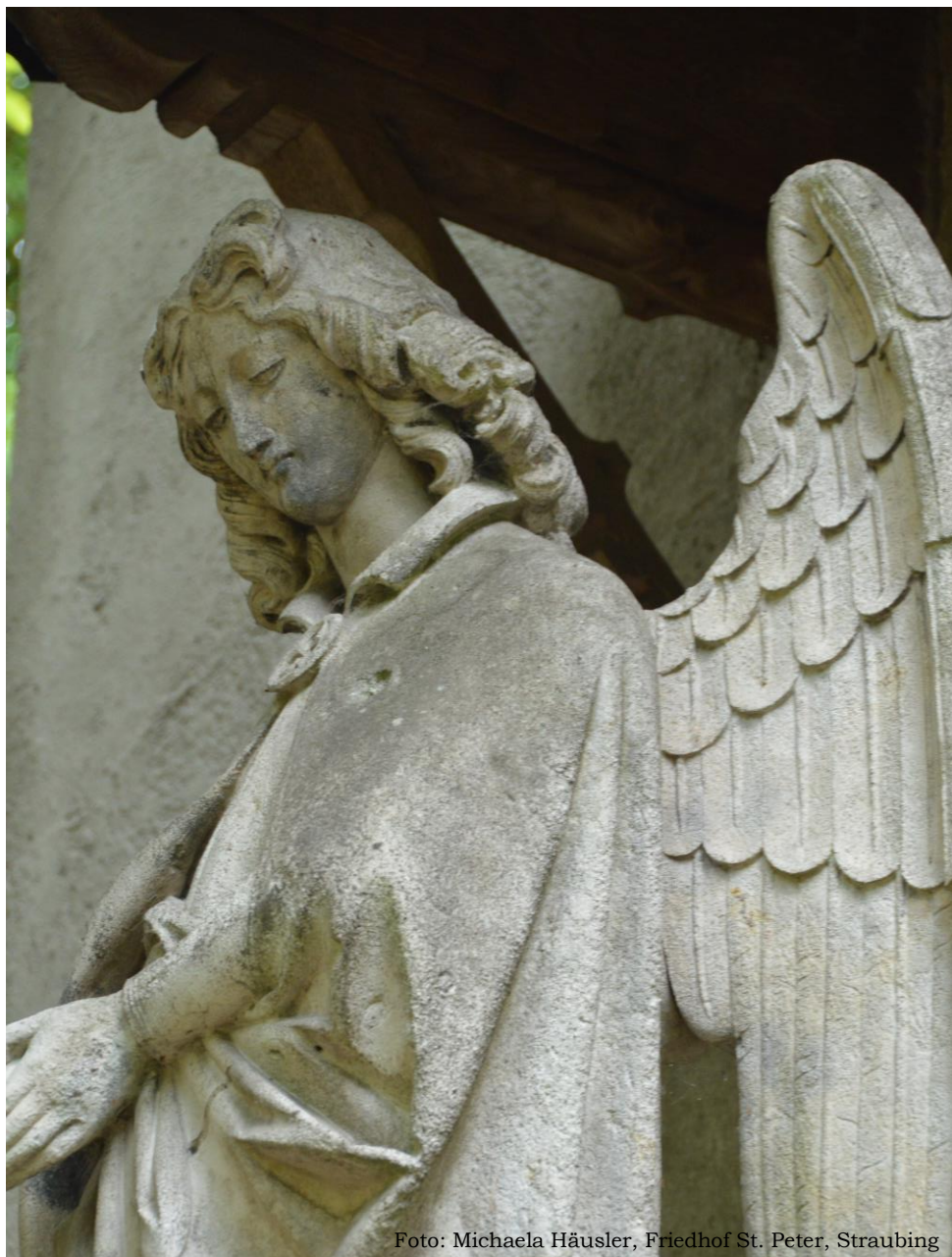
Friedhof St. Peter, Straubing

Die Toten sind nicht tot, sie sind nur nicht mehr sichtbar. Sie schauen mit ihren Augen voller Licht in unsere Augen voller Trauer.