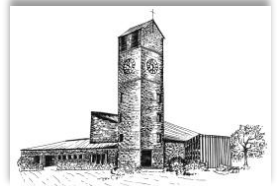
Verklärung Christi Rain