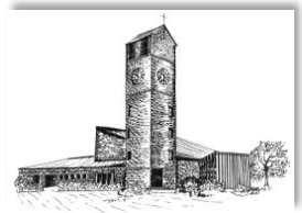
Verklärung Christi Rain