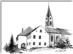
Mariä Himmelfahrt Atting