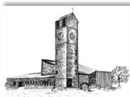
Verklärung Christi Rain