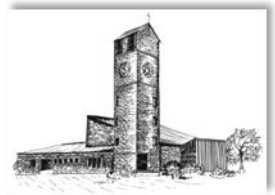
Verklärung Christi Rain