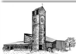
Verklärung Christi Rain

LASST UNS NICHT MÜDE WERDEN, DAS GUTE ZU TUN