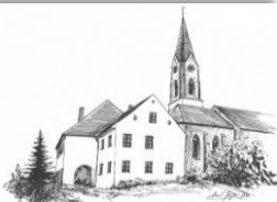
Mariä Himmelfahrt Atting