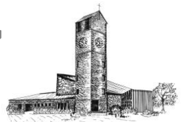
Verklärung Christi Rain