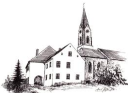
Mariä Himmelfahrt Atting