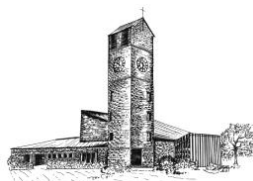
Verklärung Christi Rain