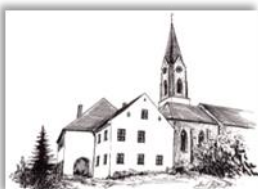
Mariä Himmelfahrt Atting