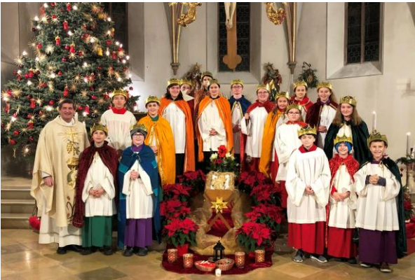
Aussendung in Atting am Fest der Hl. Familie, Samstag, 28. Dezember.