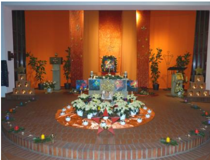
Weihnachtliches Taizé-Gebet am 27. Dezember in Rain

Es erklingen die schönsten Lieder aus Taizé und die Kirche wird dazu wieder festlich geschmückt sein.