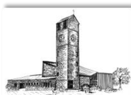
Verklärung Christi Rain