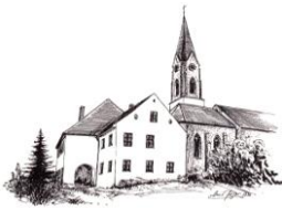
Mariä Himmelfahrt Atting