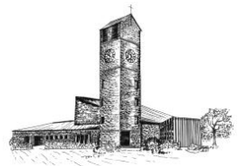
Verklärung Christi Rain