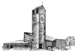
Verklärung Christi Rain