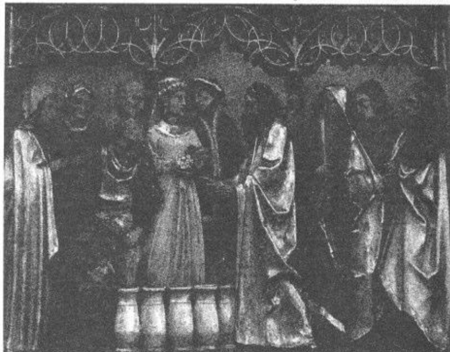
Heilig-Geist-Kirche Mannheim, Foto: Tillmann

Jesus bejaht das Leben: Er selbst ist Gast auf der Hochzeitsfeier, ist mitten unter den Menschen und hilft in der Not. Jesus ist kein Asket. Er geht raus und ist da, wo Menschen sich versammeln. Sie bringen zu ihm, was sie bedrückt hat. Ihre Krankheiten, Ängste und Nöte. Große und kleine Sorgen – auch den Weilmangel. In der Begegnung mit Jesus geschieht, was keiner für möglich hält: Aus Wasser wird Wein, aus Mangel wird Fülle, aus Krankheit wird Lebendigkeit.